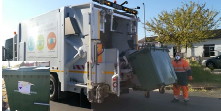
Merci aux agents de collecte pour leur engagement au sein des services communautaires et leur sens du service public.